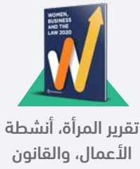
تقرير المرأة، أنشطة الأعمال، والقانون