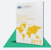
تقرير الكتاب السنوي للتنافسية العالمية