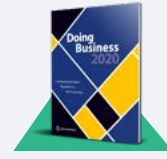
تقرير ممارسة الأعمال 2020