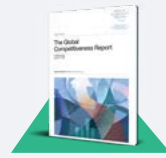
تقرير التنافسية العالمية