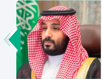
ولي العهد الأمير محمد بن سلمان افتتاح أعمال السنة الأولى من الدورة الثامنة لمجلس الشورى الخميس 2020/11/12م

”إن إصلاح بيئة العمل وتطوير الخدمات ممكن رئيسي، فعلى سبيل المثال تم تخفيض إجمالي متطلبات التراخيص الاستثمارية بنسبة 50 في المائة، وإصدار السجلات التجارية وتراخيص البلدية بشكل فوري وإلكتروني، وتخفيض الحاويات في 24 ساعة بعد أن كانت تصل إلى أسبوعين“.