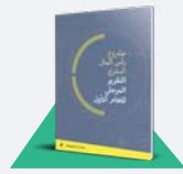
تقرير رأس المال البشري